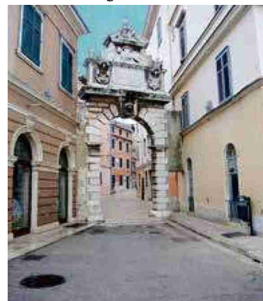
Portes anciennes et ruelles pavées l'histoire est à fleur de bâtiments. NB

L'accueil est professionnel et la sécurité dans tout le pays est au moins aussi élevée qu'en Suisse. Les années de guerre font partie d'un passé lourd qui laisse encore une économie branlante et un taux de chômage de 23%.