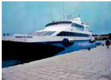
Le Prince de Venise emmène les visiteurs de Porec à Trieste en moins de 2h. NB

Themen-Nr.: 865.001 Abo-Nr.: 1073394 Seite: 23 Fläche: 42'863 mm 2