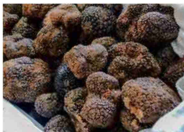
La chasse aux truffes peut être le but d'un voyage... NB