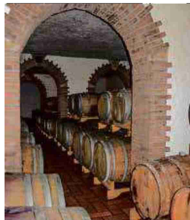
Il est possible de visiter des domaines viticoles. NB