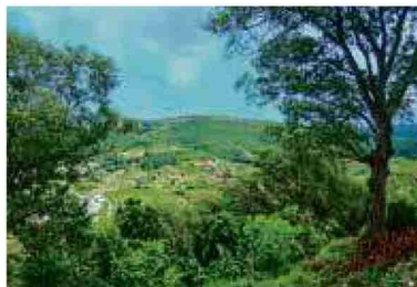
Les villages sont éparpillés dans une nature luxuriante. Ici aux confins de la Slovénie NB